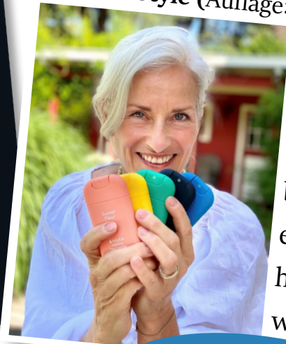
Silver & Style (Auflage: 80K)

„Es hat mich wirklich überzeugt! Die Verpackung ist biologisch abbaubar, es killt Viren und hat noch viele weitere Benefits“