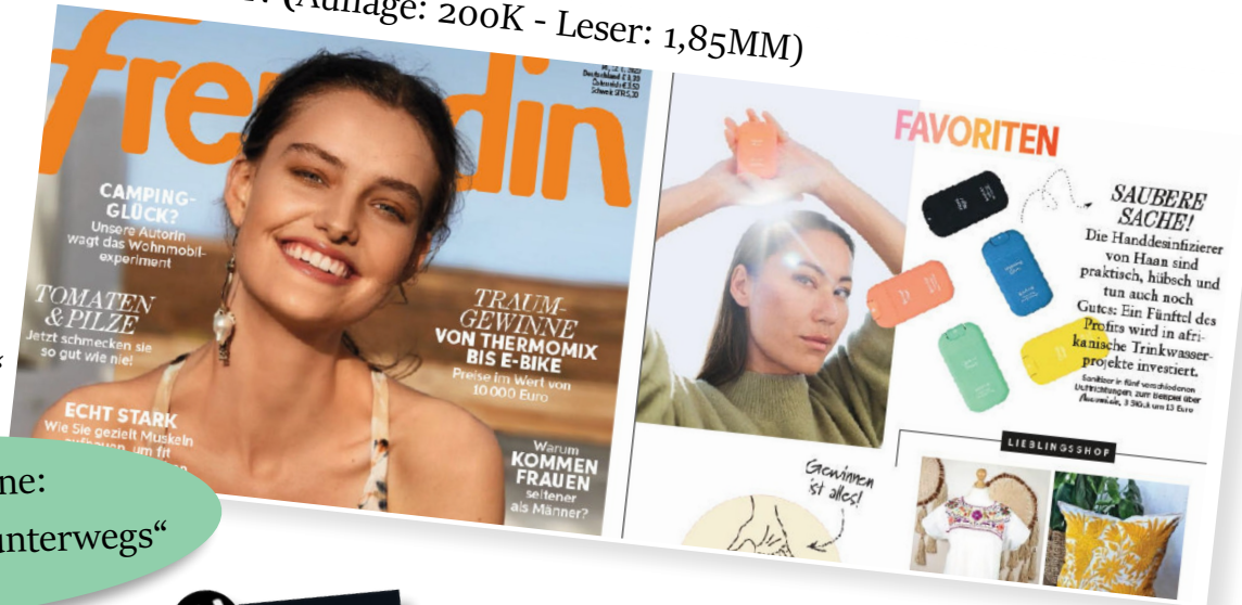
FREUNDIN (Auflage: 200K - Leser: 1,85MM)

„Saubere Sache! Praktisch, hübsch und tun auch noch Gutes.“